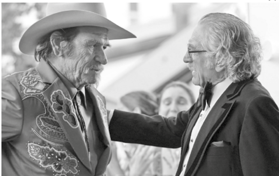
Tommy Lee Jones (E) e Robert de Niro (D) estrelam a comédia de bastidores ‘Vigaristas em Hollywood’

CASA GUCCI (House of Gucci. EUA. Dir: Ridley Scott. Drama e Biografia. 14 anos). Baseado na história de Patrizia Reggiani (Lady