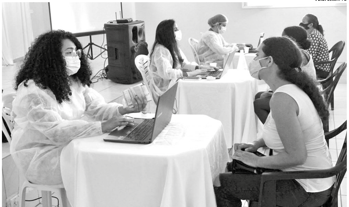
Informações obtidas através do Censo da Pessoa com Deficiência subsidiarão o Governo do Estado na implantação de políticas públicas para essa parcela da população

Nesta semana, o governador João Azevêdo anunciou que o programa conseguiu ultrapassar a meta estabelecida e já contabiliza mais de 12.400 cirurgias eletivas realizadas pelo Opera Paraíba.