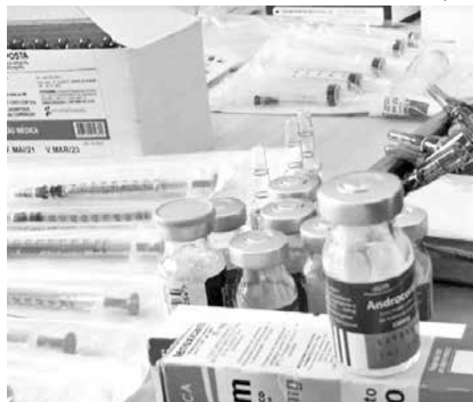
Material hospitalar e testes estavam guardados na casa do ex-servidor

Ilamilto informou que o homem preso é ex-funcionário da Secretaria de Saúde do município de Cajazeiras. “O importante é descobrir como ele teve acesso a todo esse material, sua origem e se houve desvio de algum órgão público”, explicou. Ele disse ainda que o ex-servidor municipal deve responder pelos crimes de peculato e contra a saúde pública.