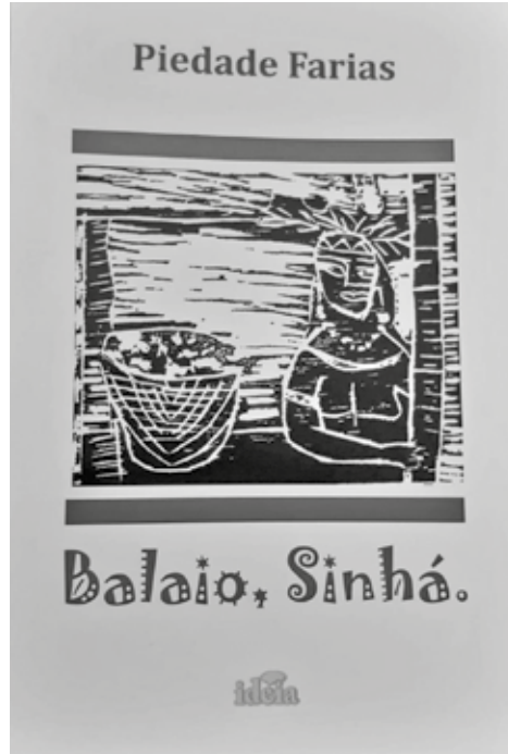
Coletânea publicada pela Editora Ideia contém ilustrações assinadas por Rose Catão