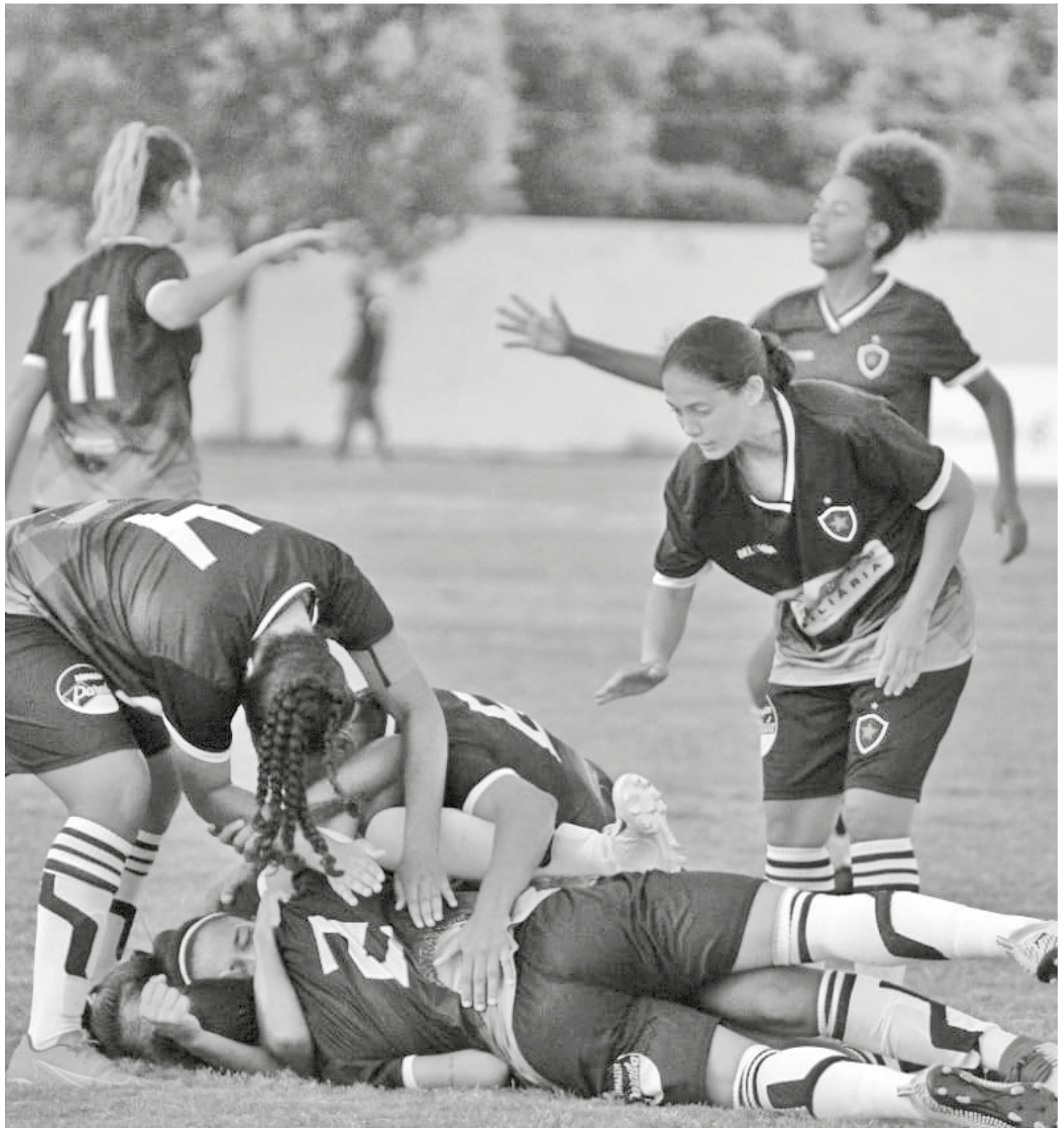
Jogadoras do Botafogo comemorando a marcação de um gol, uma cena que se repetiu bastante durante os jogos do Belo neste Campeonato Paraibano