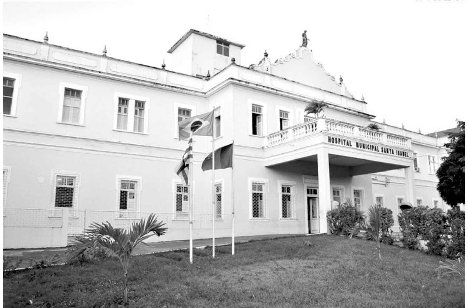
Hospital Santa Isabel, localizado em João Pessoa, já possui quatro pacientes preparados para passarem por cirurgias bariátricas após serem encaminhados por USFs

Estão aptos a passar pelo procedimento pessoas com graus dois e três de obesidade, com comorbidades; pacientes com Índice de Massa Corpórea (IMC) acima de 40, independente da presença de comorbidades; assim como pessoas com IMC de 35, com comorbidades.