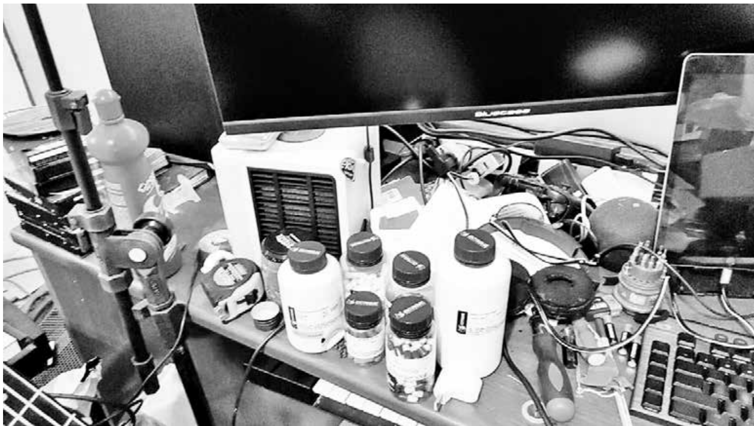
Material encontrado pelos agentes da Polícia Federal durante a Operação Lobos 2, desencadeada em vários estados do país e que prendeu 25 pessoas